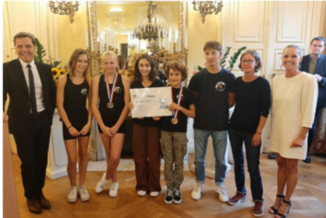
Les monte en l'air (escalade).

Mercredi 21 septembre 2022, la ville de Lisieux organisait une réception pour mettre à l'honneur ses sportifs qui ont brillé dans l'année.